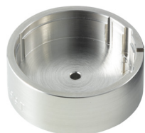
Porte-pièces Pour enlever la tige H8XXX.1T