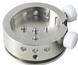
Porte-pièces Pour poser les aiguilles H8XXX.1A