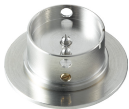
Porte-pièces Pour poser les aiguilles H6XXX.1A2