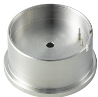
Porte-pièces Pour enlever la tige H6XXX.1T