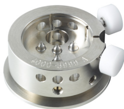
Porte-pièce Pour poser les aiguilles H5XXX.A