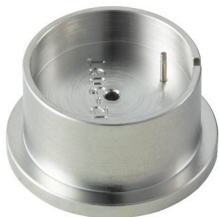
Porte-pièce Pour enlever la tige H5XXX.1T