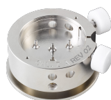
Porte-pièces Pour poser les aiguilles HZXX.2A