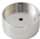
Porte-pièces Pour enlever la tige HZXX.1T