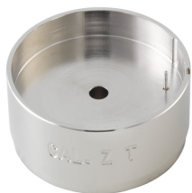
Porte-pièces Pour enlever la tige H ZXX.1T