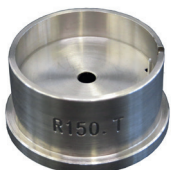
Porte-pièces Pour enlever la tige H R150.1T