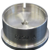
Porte-pièces Pour poser les aiguilles H R150.1A