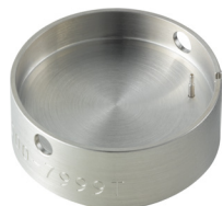
Porte-pièces Pour enlever la tige H7XXX.1T