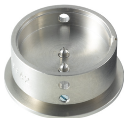
Porte-pièces Pour poser les aiguilles H7XXX.1A