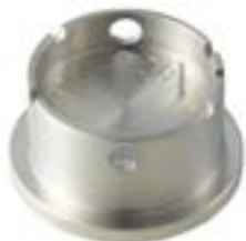
Porte-pièces Pour enlever la tige H70X.1T