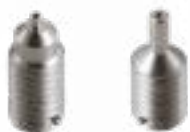
Vis de support centre/périphérie Options porte-pièces Swiss Made .0.8mm/1.4mm