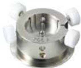
Porte-pièces Pour poser les aiguilles H706.1A