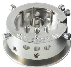
Porte-pièces Pour poser les aiguilles H5XXF.1A