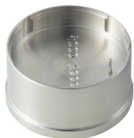
Porte-pièces Pour enlever la tige H5XXX.1T