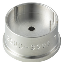
Porte-pièces Pour enlever la tige H35XX.1T