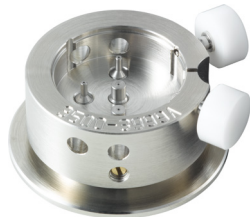
Porte-pièces Pour poser les aiguilles H35XX.1A