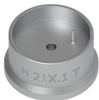
Porte-pièces Pour enlever la tige H21X.1T