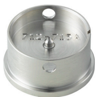
Porte-pièces Pour poser les aiguilles H71X.1A