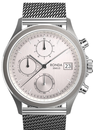
alle Abbildungen 100%