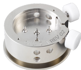
Werkhalter Zeiger setzen H ZXX.2A