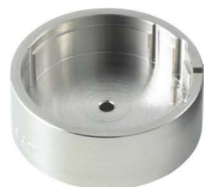
Werkhalter Stellwelle entfernen H8XXX.1T