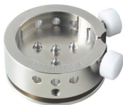
Werkhalter Zeiger setzen H8XXX.1A